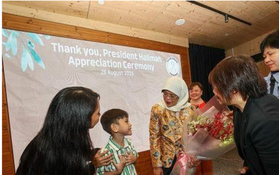
银丝带等组织感谢哈莉玛 支持推动心理健康意识

她希望能组织一个祖父母和外公外婆网络，教导他们如何察觉孙子的变化。例如，当孩子碰到压力时，该如何反应和处理。